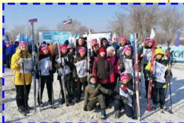
Большая дружная семья Чудепкенов