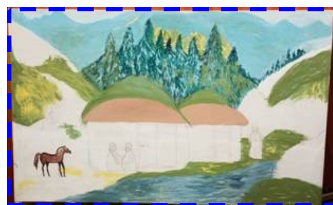
Декорации к спектаклю «Чатхан»