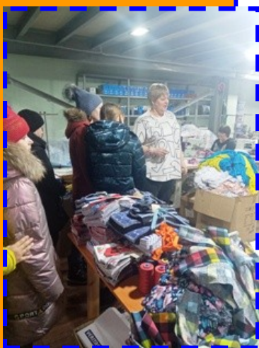
Экскурсия в рамках профорientации

20 февраля 2023 года учащиеся профиля «Швейное дело» 5, 6, 8 и 9 классов вместе со своими педагогами Евпатовой М.Н. и Василенко О.М. ездили на производство «Абаканский трикотаж» . На экскурсии девочки познакомились с оборудованием, процессом пошива изделий верхнего и бельевого трикотажа для взрослых и детей. Увидели, какую удобную и качественную одежду для повседневной жизни, спорта и активного отдыха выпускает производство «Абаканский трикотаж». Экскурсия была познавательной и очень понравилась девочкам.