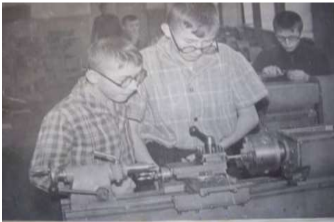
В школьных классах и мастерских.