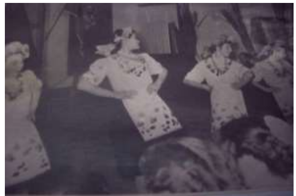
Ансамбль песни и пляски и прославленный хор