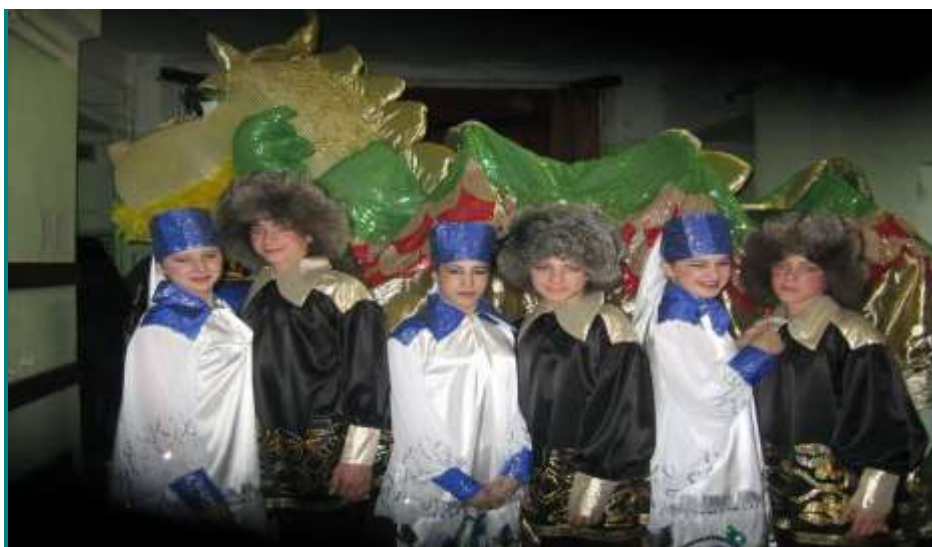
» Орлицы и горлицы»